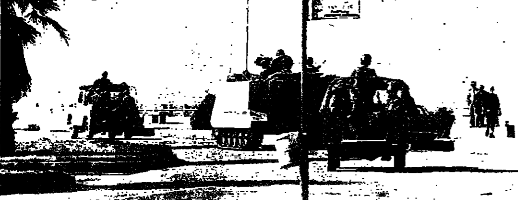
... ونزل السمسم في الكورنيش

لأنها بيروت البحرية تفرقت الزوال الى اليوم الممسيخ... خرج المحبون، الامهات، الاطفال والشيوخ... حلى السمك لزل الى الكورنيش ويمسح الطريق البحرية... ولي غلة من الزمان، خلت الحرية لها... والصفاء الزرق، اعطى السمك، اورقا بيوتية... ويميدا من الرصيف وتحتيرت اهل العاقين الى زهتها.